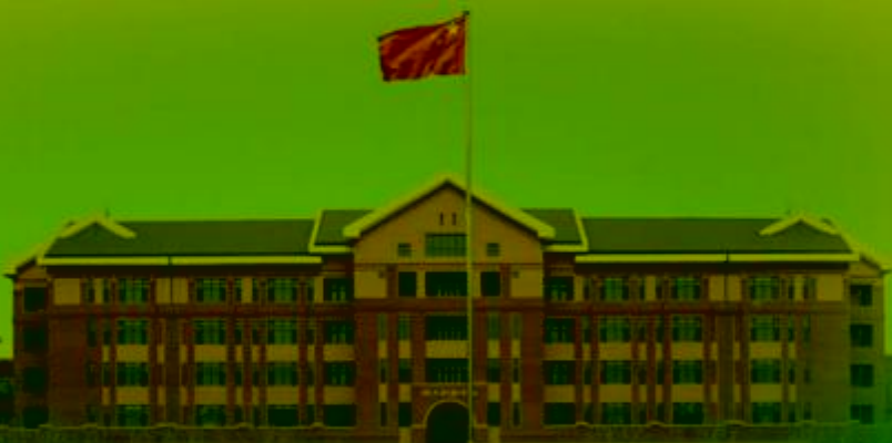
天津机电职业技术学院

TIANJIN VOCATIONAL COLLEGE OF MECHANICAL AND ELECTRICAL ENGINEERING